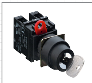
Rearme Manual e Automático