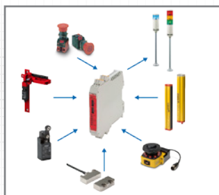
Compatível com muitos dispositivos de segurança